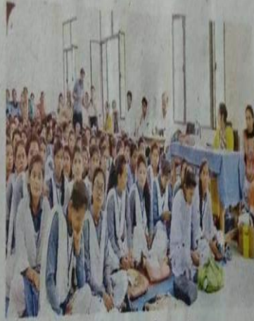
कपकोट महाविद्यालय में आयोजित कार्यक्रम में उपस्थित छात्राएं