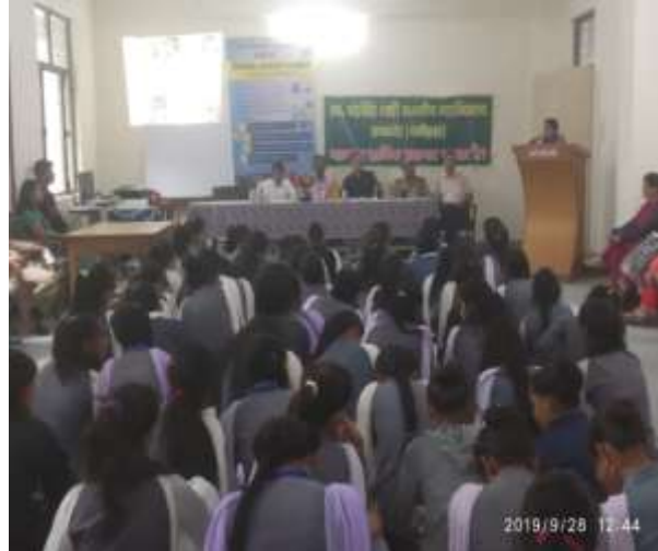
SHO Kapkote educating students about the negative consequences of drugs, 28/09/2019