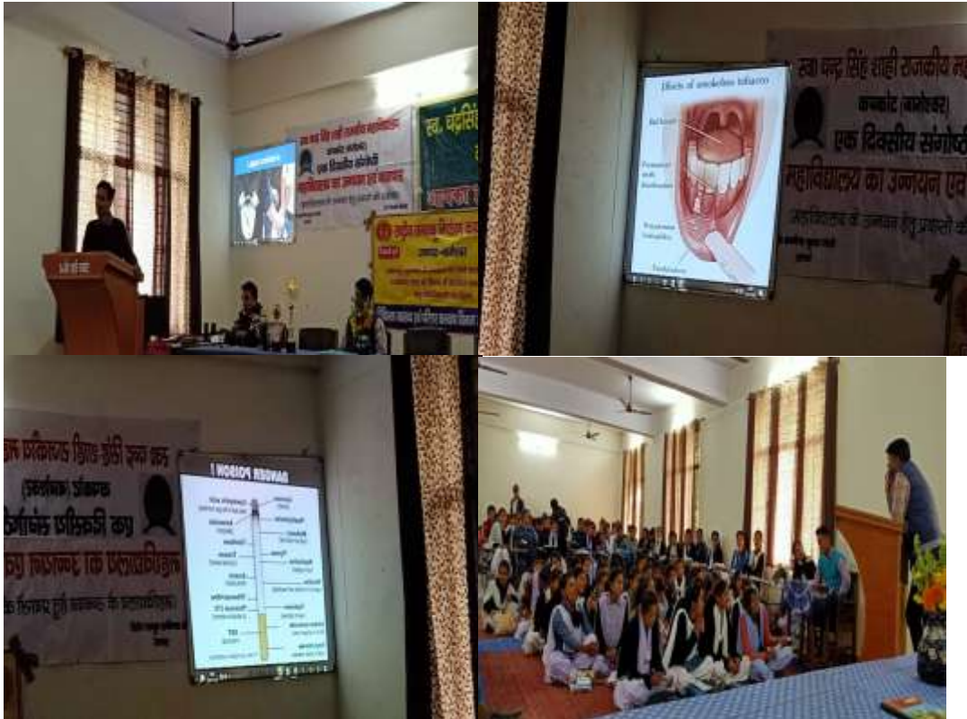
Health counsellors educating students about the negative consequences of tobacco, 21/11/2019