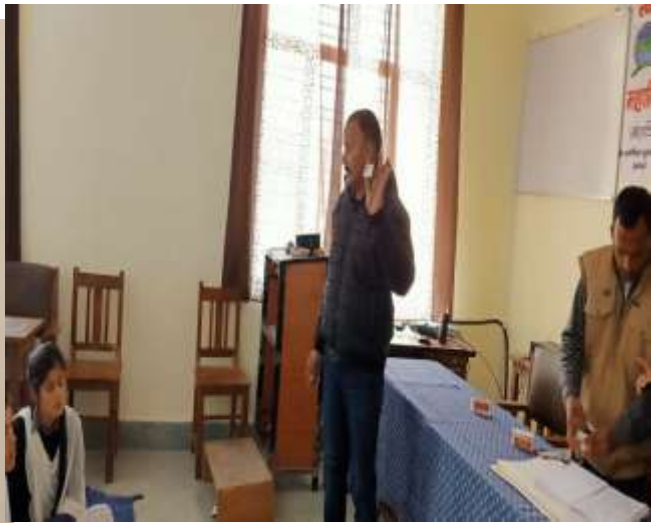
Head of the insitute adressing students on national deworming day, 10/02/2020