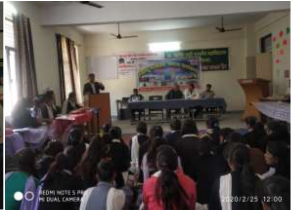
Health counsellors are providing mental health related information to students, 25/02/2020