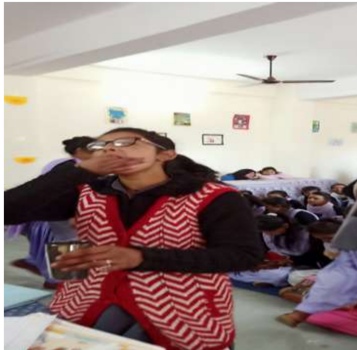
Distributing Albendazole tablets on national deworming day, 10/02/2020