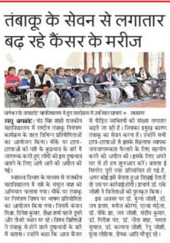
News Paper cutting of program held on 21/11/2019