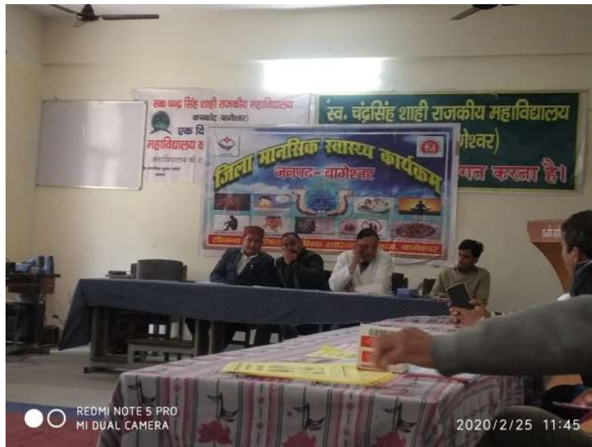
Mental health awareness program, 25/02/2020

Principal Principal Swargiya Chandra Singh Shahi Government Post Graduate College Kapote, Bageshwar