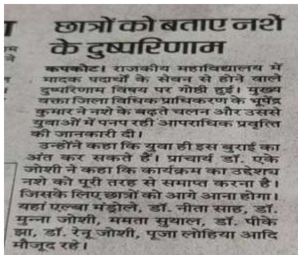
News Paper cutting of program held on 28/09/2019