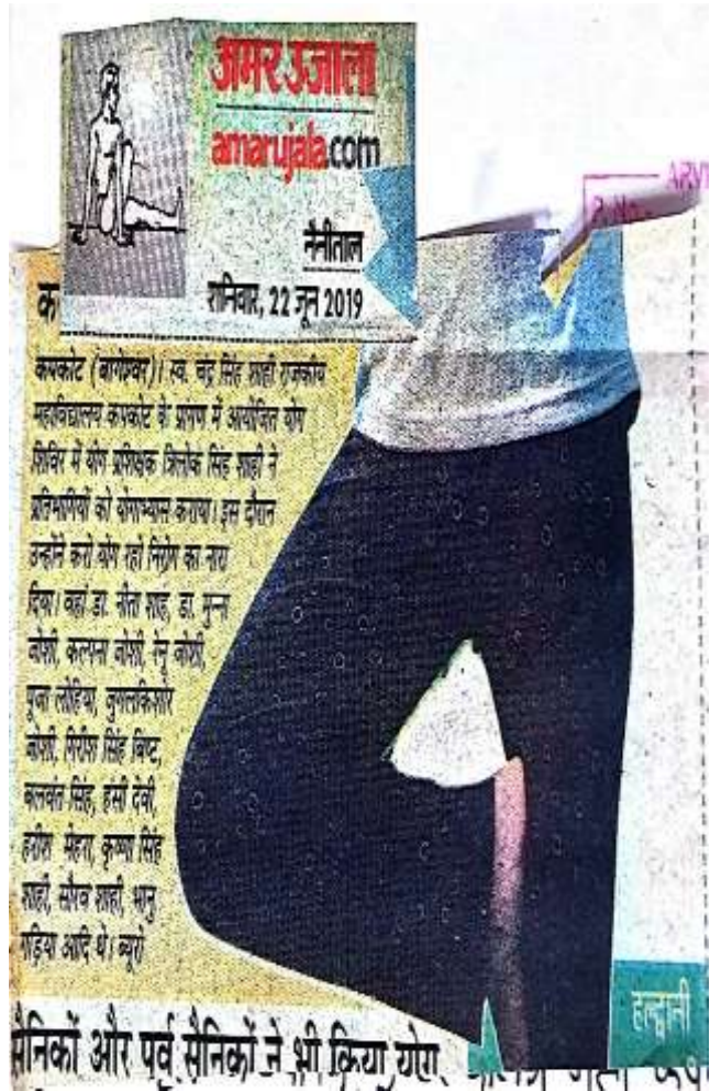
News Paper cutting of program held on 21/06/2019