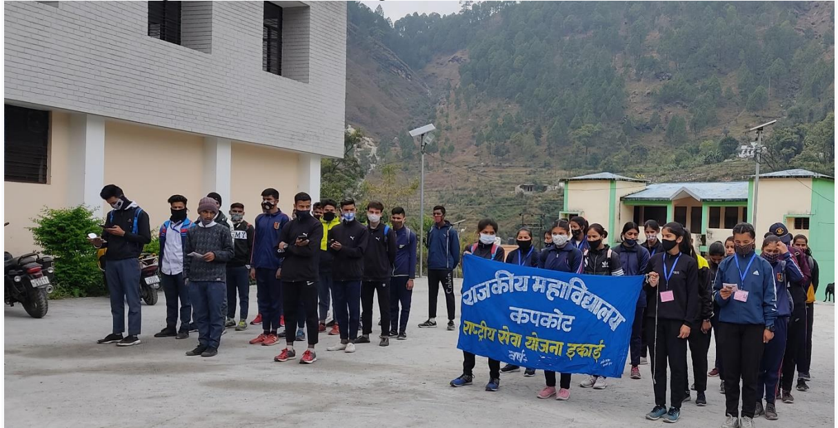
The gathering for awareness rally for water harvesting

On 25/03/2021 on the sixth day of Seven Day National Service Scheme Camp was started with the target song of National Service Scheme. Awareness rally was taken out for water harvesting with narrow slogans for water conservation in the society from college to village-Danon, making rural people aware about water harvesting and cleanliness campaign was conducted at village -Khadkheda and village-Danon.