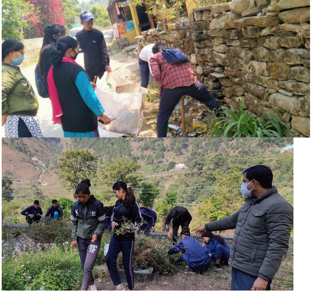
Students and faculty engaged in Cleanliness drive in Village Ason

On 22/03/2021 third day of Seven Day National Service Scheme Camp was started with a " Voters Awareness Rally ". A Cleanliness campaign for the benefit of society was run by the volunteers in village Ason, Bhajji Bela under labor session, in which disposal of the collected garbage was done with the cleaning of drains, hand pumps etc.