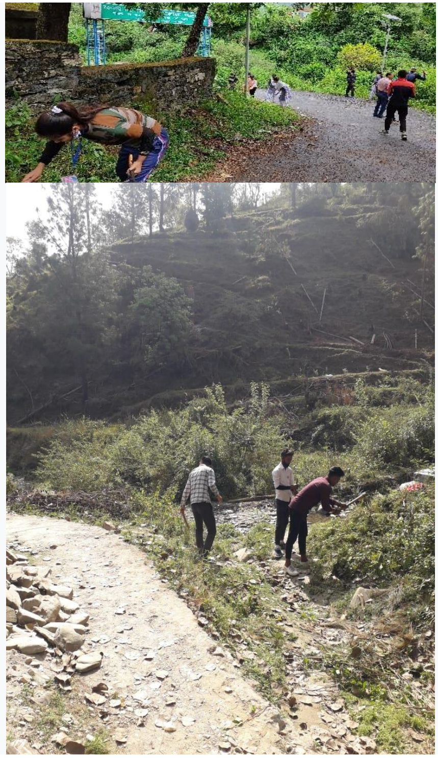
Cleanliness Drive on road