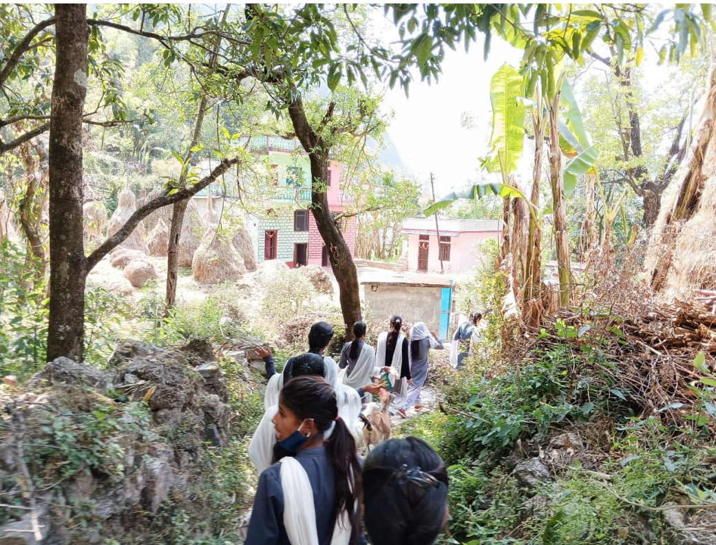
Students are campaigning for hygiene and sanitation awareness