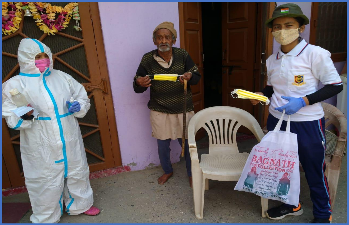
NSS Volunteers providing Masks to villagers

On 25/3/2022 , on the occasion of the fifth day of the special seven-day NSS camp all the volunteers left the college at 10:00 am for labor work in adopted village Ason. NSS volunteers started water conservation and cleanliness campaign to the awareness of society in Ason Gram Sabha. While running the program, many cleanliness activities were carried out around the streams and drains of the Gram Sabha and a water conservation awareness program was conducted in the village.