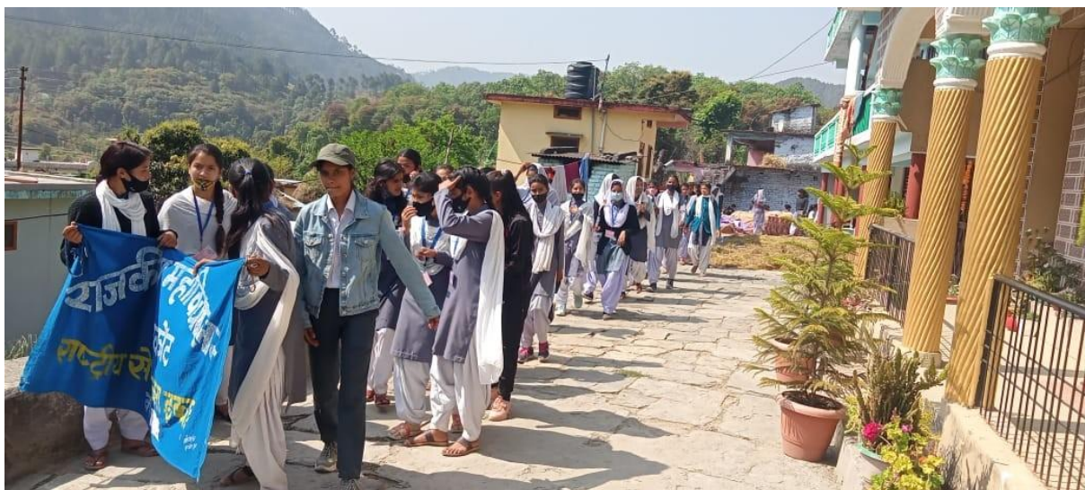
Rally for Polyethene Eradication in nearby Ason Village