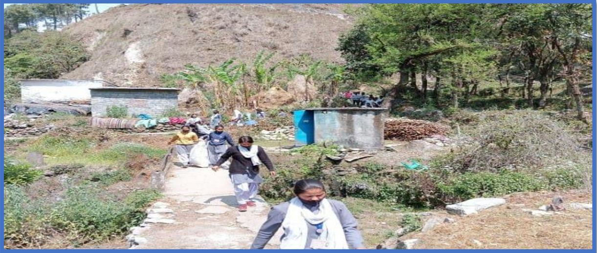
Students are cleaning beside the local water channel