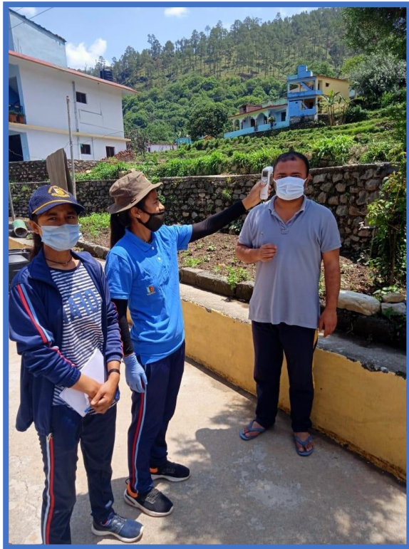
Door to door awareness program and health check up by NSS Volunteers