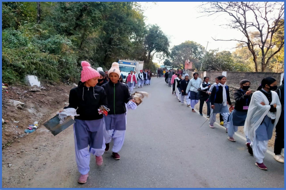
Rally for Polythene eradication in Public road in Ason-Kapkote State Highway